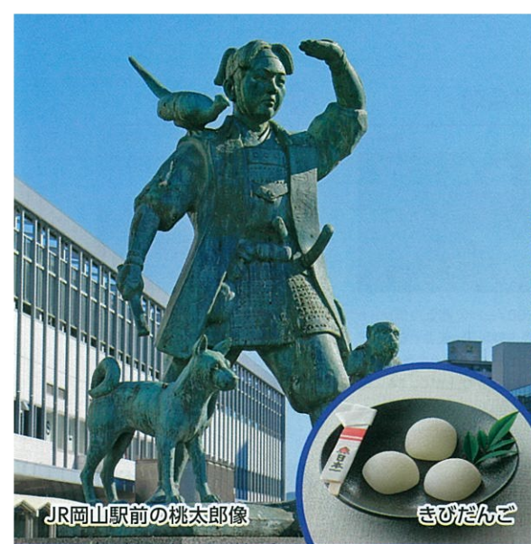
JR岡山駅前の桃太郎像