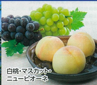
白桃・マスカッポ ニューピオーネ